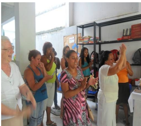
Reunião mensal com jovens mulheres empreendedoras