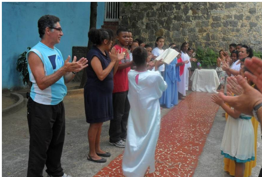
Momento da entrada da Bíblia