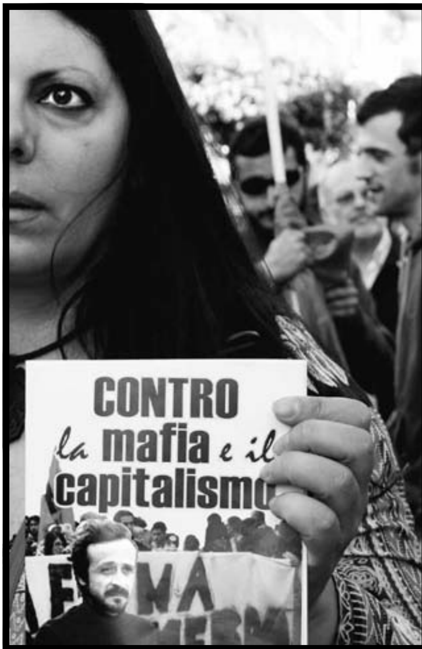
Un momento del corteo del 9 maggio.