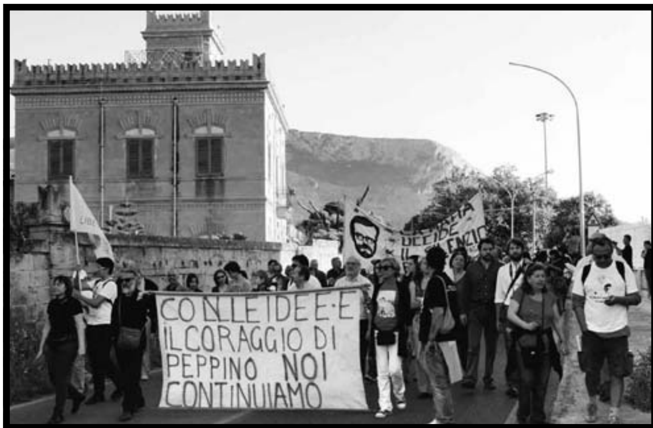
Un momento del corteo del 9 maggio.

Elisa Chiodarelli ha realizzato un documentario sul Barefoot College che verrà presentato in anteprima al festival Internazionale Ferrara 2010, in programma dal 1° al 3 ottobre.