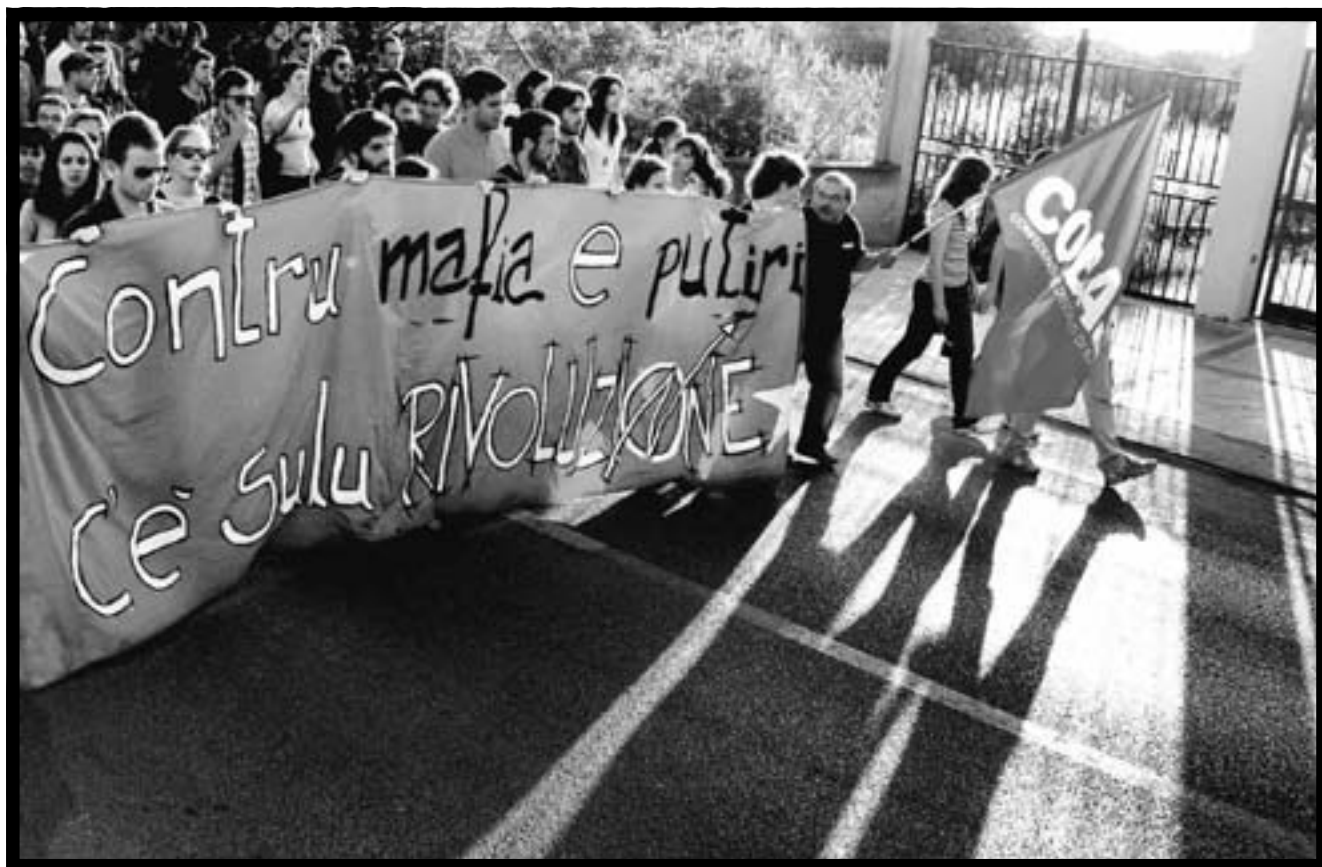
Un momento del corteo del 9 maggio.

La globalizzazione, il piano del capitale, è stata descritta, dipinta, come il regno