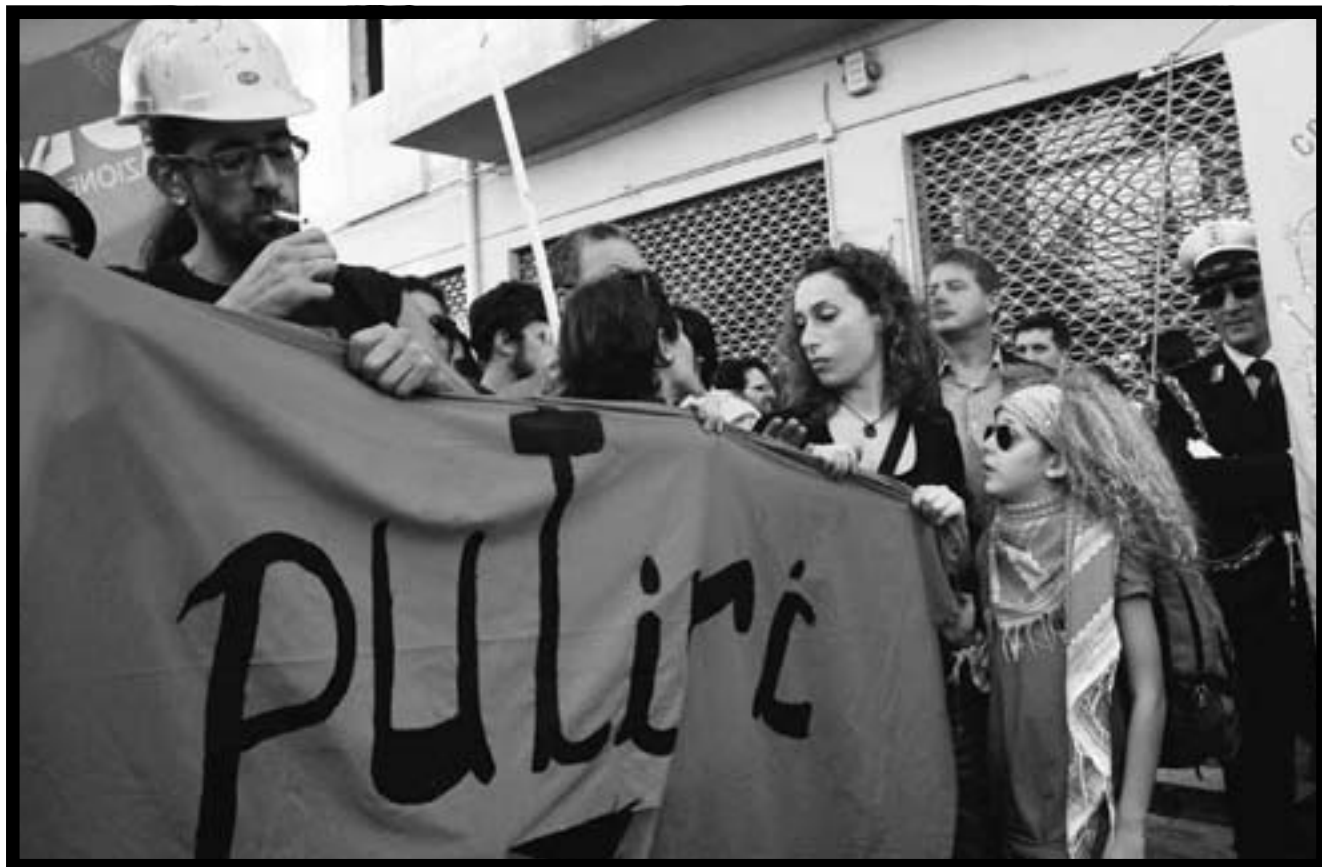
Un momento del corteo del 9 maggio.