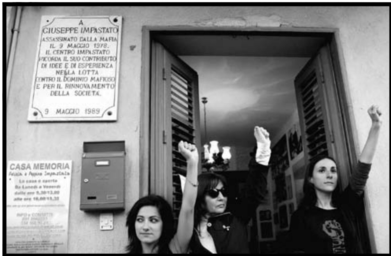
I parenti di Peppino Impastato all'ingresso di Casa Memoria.

La Chiesa a volte si ritira spaventata dai progetti rivoluzionari e molti cristiani (troppi) cercano riparo sotto le sue ali, così, questa umanizzazione che dovrebbe farsi concreta, si allontana. Gesù aveva dato un altro consiglio: «Gli abitanti della terra moriranno per la paura... le forze del