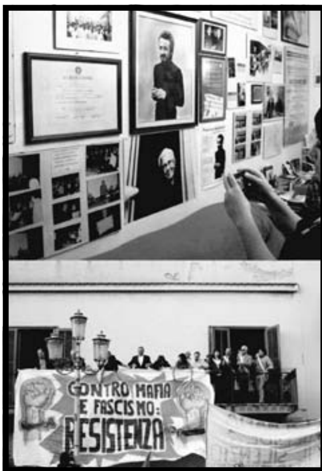
In alto l'interno della casa di Peppino Impastato, oggi Casa Memoria.

Mi aspetta la cena. Forse anche oggi ho superato il peso.