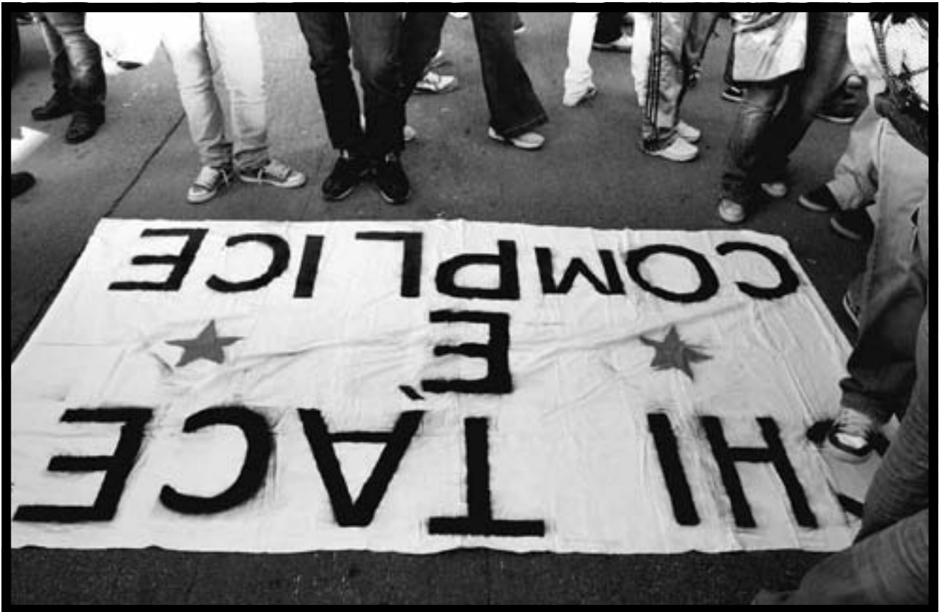
Prima della partenza del corteo del 9 maggio.

La civiltà della colpa (e dell'onore inteso come capacità di svolgere al meglio ciò che si è chiamati a fare) è, a pensarci bene, la civiltà del servizio, dell'abnegazione totale a un fine. Quando vieni meno al tuo dovere, allora è normale fare ammenda. I samurai, fedeli alla via del bushido, della spada, si toglievano la vita. La cultura giapponese ha mantenuto fino alla fine dell'Ottocento la pratica del seppuku , il suicidio rituale. Il guerriero procedeva al proprio sventramento mentre un suo secondo gli tagliava la testa. Per compiere il rito l'unica arma ammessa era la wakizashi, la spada corta che ogni samurai aveva il diritto di portare insieme alla katana, la spada lunga (mentre al resto della popolazione era