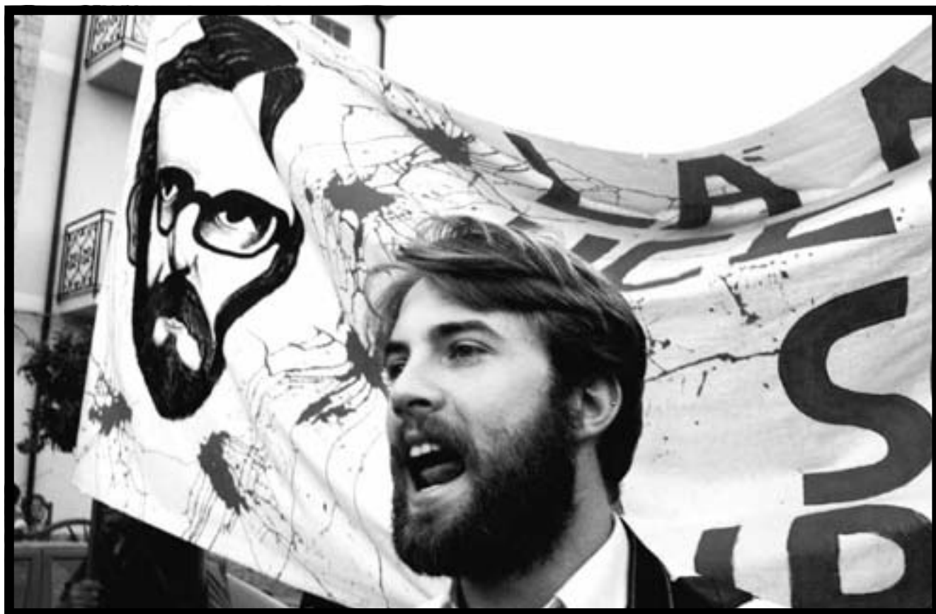
Un momento del corteo del 9 maggio.

Post scriptum: Ma allora il greco e il latino davvero non servono a niente?