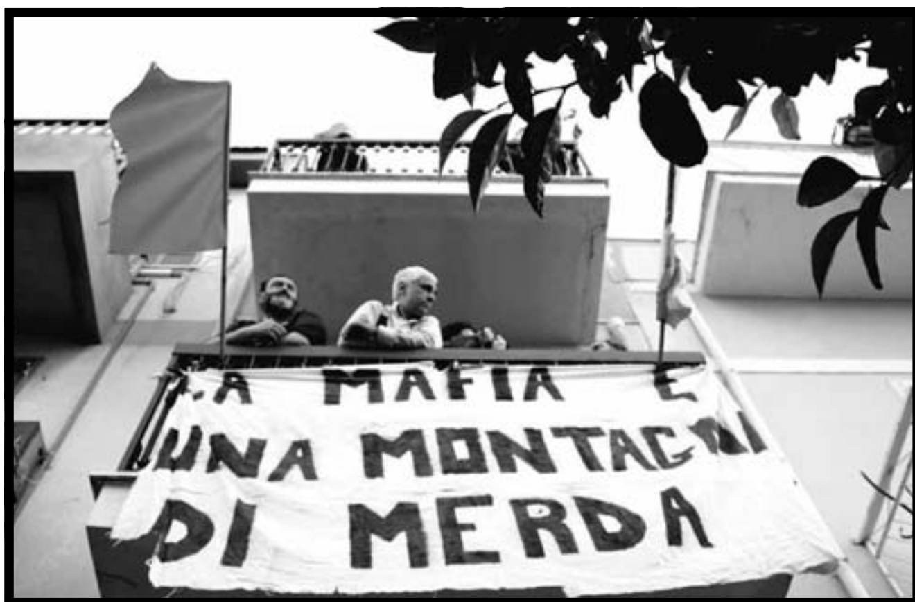
Il balcone di Casa Memoria.

I nazisti l'hanno occupata per sei anni, scaraventando sopra di essa una ferocia selvaggia e incontrollata, come se la bellezza di questa città e l'originalità della sua cultura rappresentassero la loro cattiva coscienza e, al tempo stesso, una sfida impari e gloriosa per chi la subiva. La rabbia del nazionalsocialismo contro questo angolo vivo e illuminato dell'Europa slava ha rivelato un mostruoso complesso di inferiorità davanti a un popolo pacifico, laborioso, avanzato e,