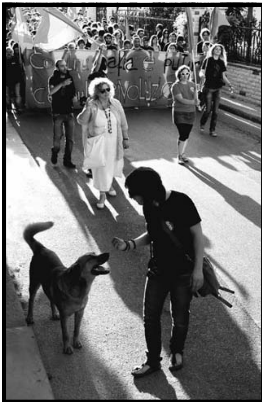
Un momento del corteo del 9 maggio.