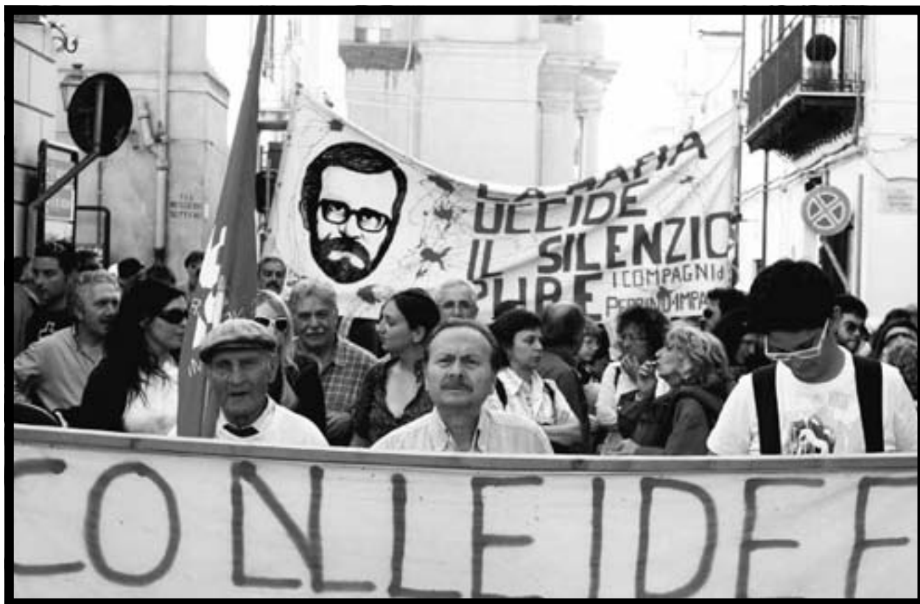
Un momento del corteo del 9 maggio.