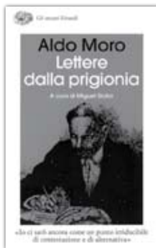
Aldo Moro, Lettere dalla prigionia , a cura di Miguel Gotor Einaudi, Torino, 2008 pp. 400, Eur 17,50.

Il libro è diviso in due parti. La prima contiene tutte